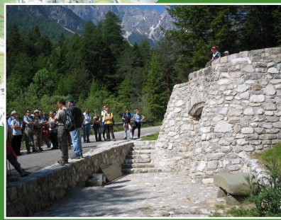
Fornace da calce / Kiln for lime