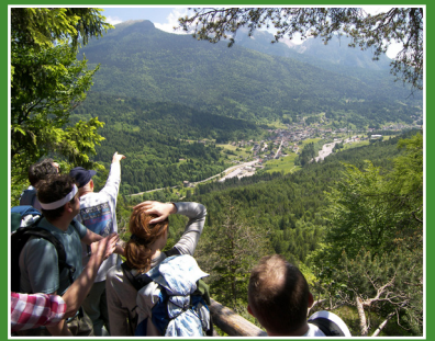
Panorama di Forni di Sopra / Forni di Sopra view