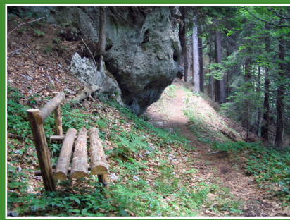
Clap dal Von