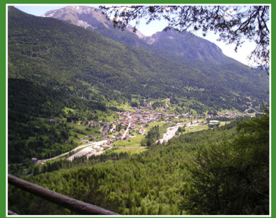
Panorama di Forni di Sopra / Forni di Sopra view