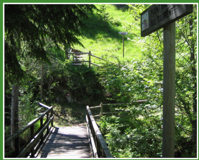
Puont dal Sirai