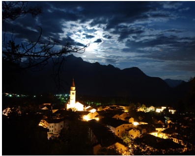
Cimolais di notte / Cimolais by night