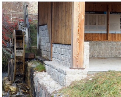
Mulino / Mill