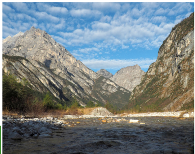
Torrente Cimolana / Cimolana river