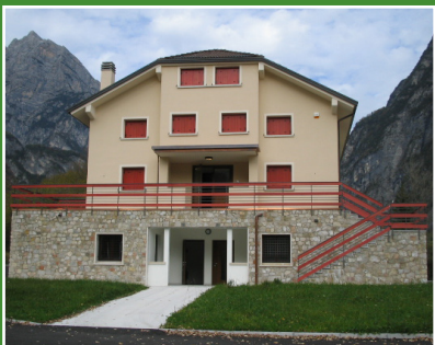
Foresteria del Parco / Park's guest house