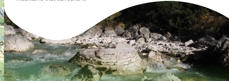
Torrente Cimolana / Cimoliana river

This trail will take you to several places that have characterised the history and economy of the town of Cimolais. It will also allow you to appreciate the morphology and natural features of the Cimoliana Valley and the imposing mountains that surround it.