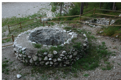
Fornace Sottrivea Sottrivea furnace