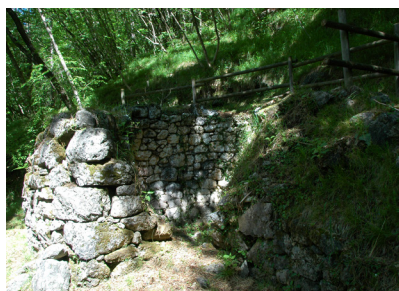
Fornace rudere Furnace ruin

You will also undoubtedly be enchanted by the charming Meduna Valley, its crystal-clear waters, and its villages.