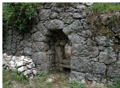
Fornace tra Ciuculat e Casa Abis Furnace between Ciuculat and the Abis house