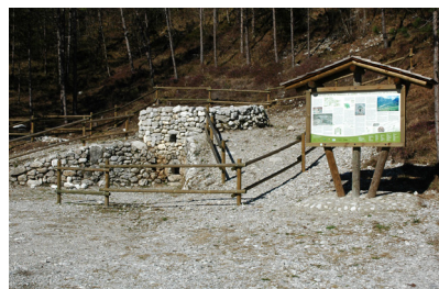
Fornace Sottrivea Sottrivea furnace