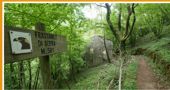
Frassaneit di Sopra