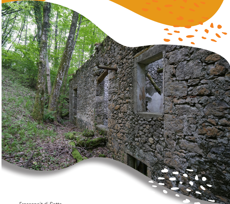
Frassaneit di Sotto