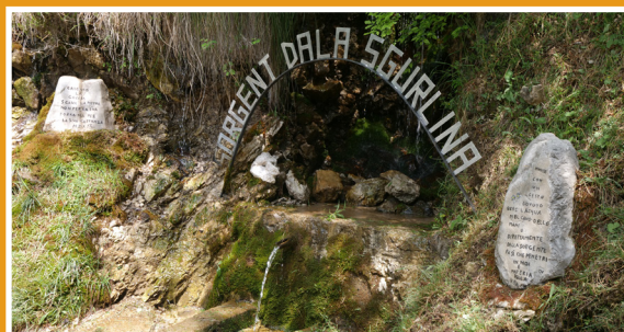
Sorgente della Sgurlina Source of Sgurlina