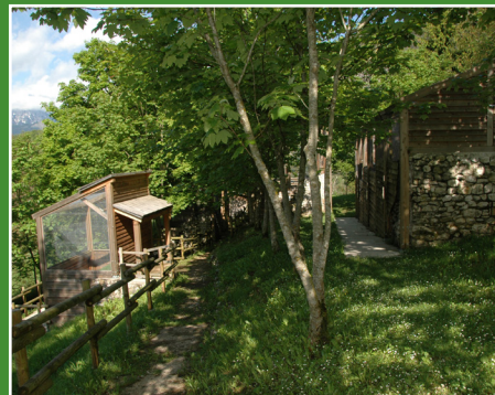
Area avifaunistica / Avifauna area