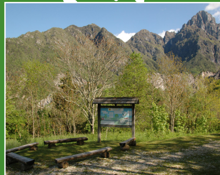
Area avifaunistica / Avifauna area