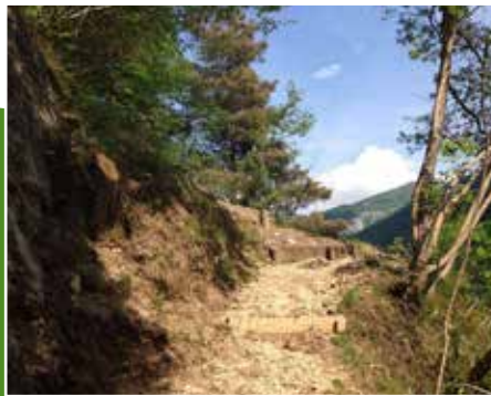
Sentiero / Path