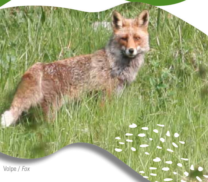
Volpe / Fox