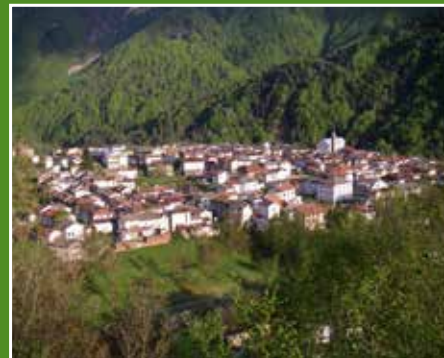
Paese di Claut Village of Claut