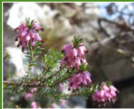
Erica / Erica