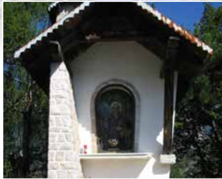
Chiesetta Col dei Piais Col dei Piais church