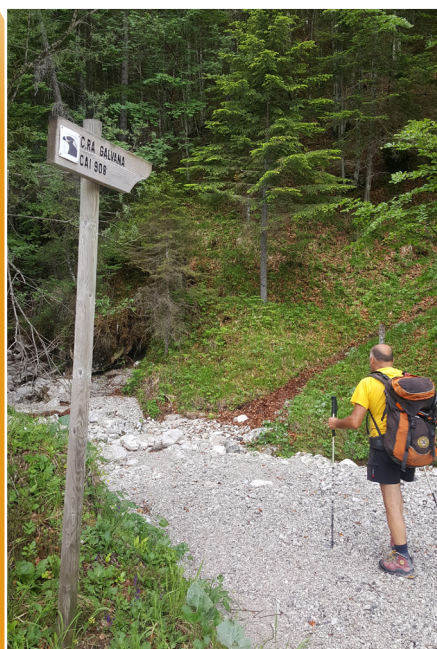
Sentiero Casera Galvana / Casera Galvana path