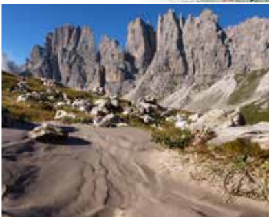
Cresta del Leone / Ridge Cresta del Leone