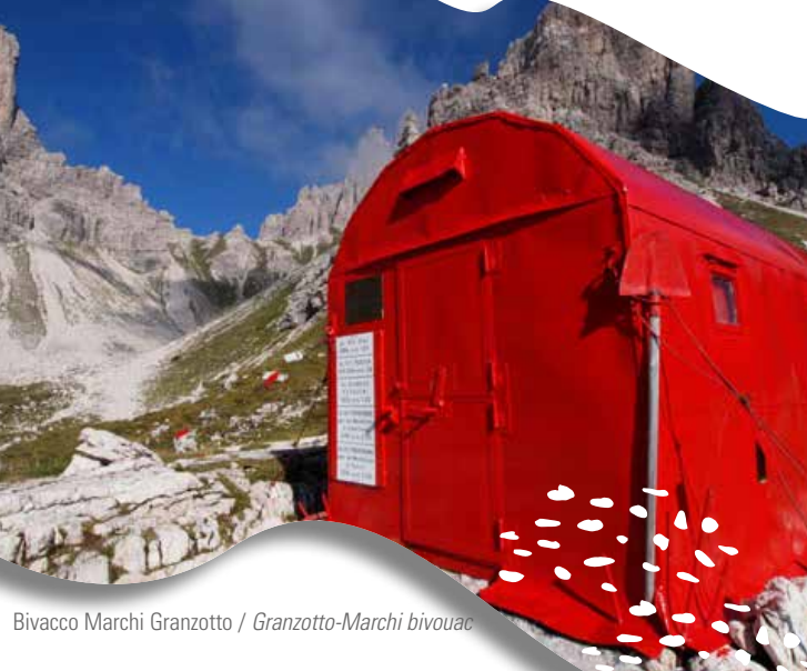
Bivacco Marchi Granzotto / Granzotto-Marchi bivouac

#buontimotivi Progetto "DolomitiCiche" Fondo europeo agricolo per lo sviluppo rurale: l'Europa investe nelle zone rurali